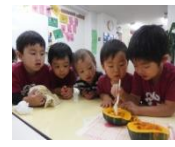
秋。過ごし易くなりました。今年はキノコをたくさん食べたいです。子供たちとはちぼちゃんサンドイッチを食べます～